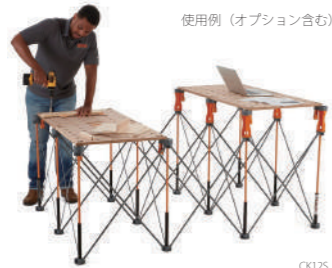
使用例 (オプション含む)